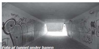
Foto af tunnel under banen