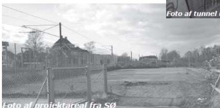
Foto af projektareal fra SØ